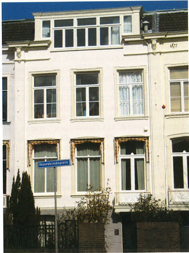
Afb. 1. De panden van het Noordeindsplein 4a-6a, Leiden, waar het Nederlands Instituut voor het Nabije Oosten tot eind 1982 was gevestigd.

Wie in ons kantoor de rij ordners met notulen, correspondentie, financiële stukken, lezingenprogramma's, contacten met drukkers en andere dossiers, aanziet en inziet, komt onder de indruk van al het werk dat verzet is. Door de vakmensen, die bereid waren voor een boekenbon het land in te gaan om een lezing te houden en op de late avond weer te keren. Door degenen, die in het Dagelijks Bestuur zaten en veel te doen hadden. In de bevlogen jaren zeventig werd van universitair en gevraagd, wat ze aan 'maatschappelijke dienstverlening' deden. Wij konden die vraag gemakkelijk beantwoorden. Maar ook de plaatselijke besturen in de 16 tot 18 afdelingen, overal in Nederland en België, mogen zeer gewaardeerd worden voor hun belangeloze inspanningen. En dit alles in goede harmonie. Dank zij al dezen heeft Ex Oriente Lux een bijzondere plaats in ons culturele leven ingenomen.