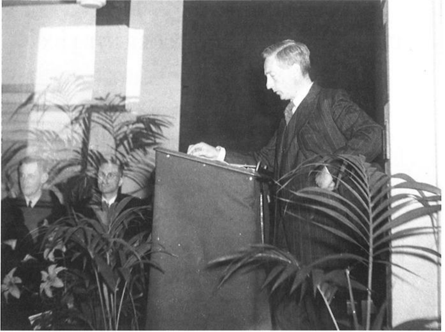
Afb. 2. Tijdens de bijeenkomst ter viering van het 10-jarig jubileum van Ex Oriente Lux op 25 september 1943 hield prof. A. De Buck een voordracht over 'Inhoud en achtergrond van het gesprek van den Levensmoede met zijn ziel', later gepubliceerd in MVEOL 7 (1947), 19-32.