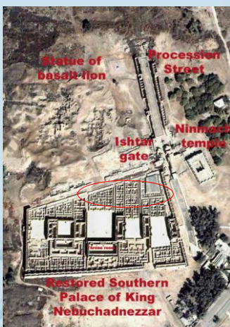
Rantsoenlijst < Zuidpaleis van Nbk