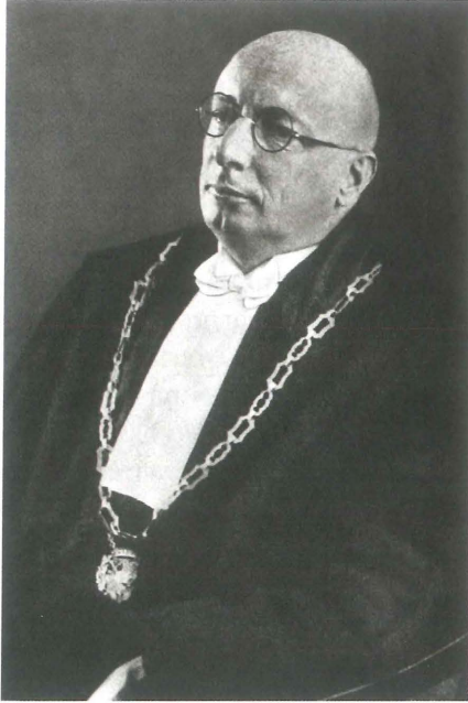
Afb. 2. Gerardus van der Leeuw (1890–1950)

publiceerde hij nog regelmatig over Egyptologische onderwerpen, waaronder in 1927 een boek over Achnaton. Een religieuze en aesthetische revolutie in de veertiende eeuw voor Christus . Internationale faam verwierf hij door zijn Phänomenologie der Religion (1933), dat vele herdrukken beleefde en in verscheidene vertalingen verscheen. Sinds 1926 was Van der Leeuw ook officieel hoogleraar Egyptische Taal- en Letterkunde, en deze combinatie zou voor zijn opvolgers worden gehandhaafd. Bij zijn 25-jarig ambtsjubileum werd hem bij wijze van Festschrift een fraai gebonden bibliografie van zijn geschriften aangeboden die ruim honderd pagina's omvat. Het merendeel daarvan heeft geen betrekking op Egypte; Van der Leeuw schreef over een breed scala van onderwerpen, bijv. ook over Bach — hij was voorzitter van de Nederlandsche Bachvereniging — en hij was bovendien korte tijd minister van Onderwijs, Kunsten en Wetenschappen in het kabinet Schermerhorn-Drees (1945/46).