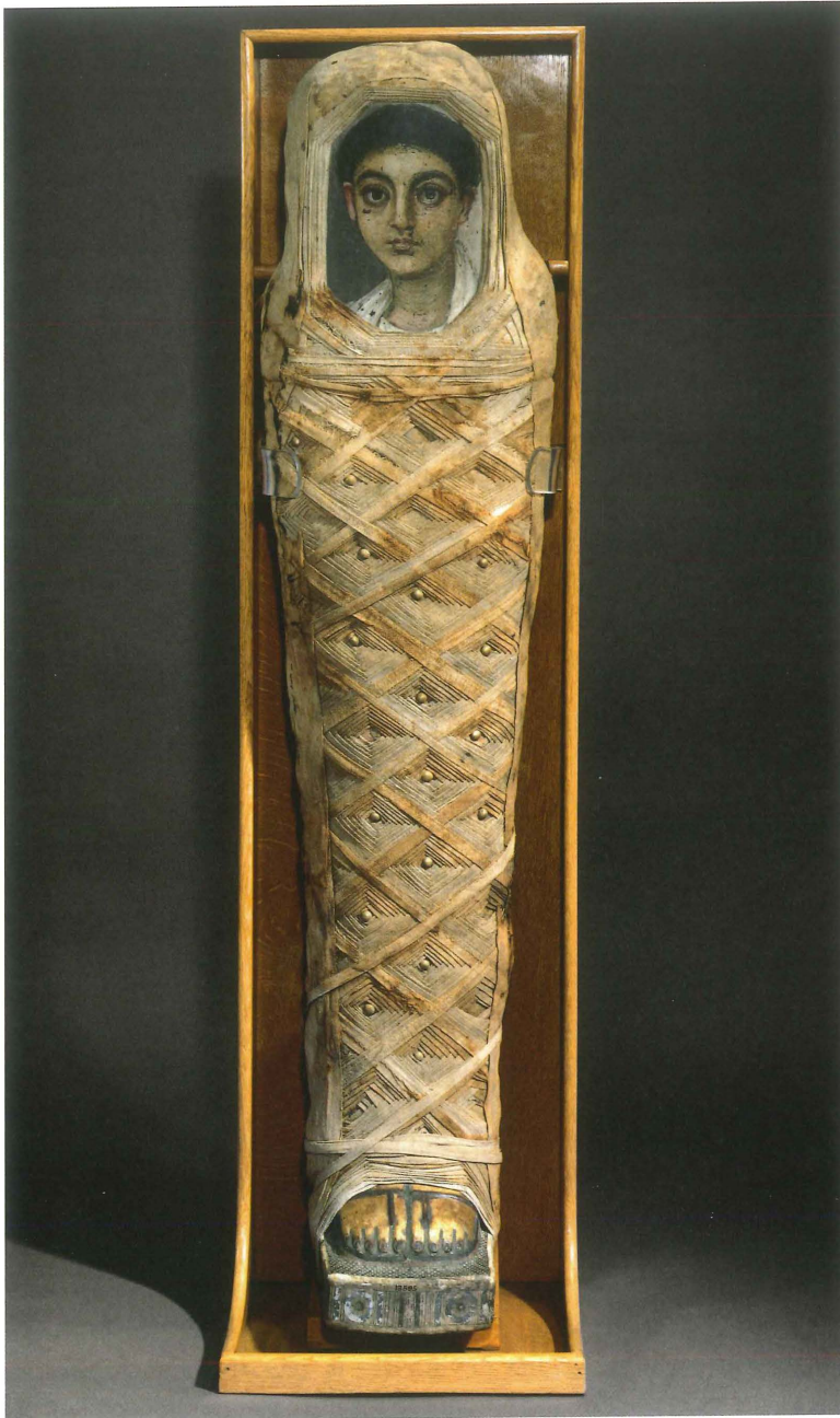
Afb. 1 Een mummie uit de Romeinse periode met een mummieportret, einde van de eerste eeuw n. Chr.