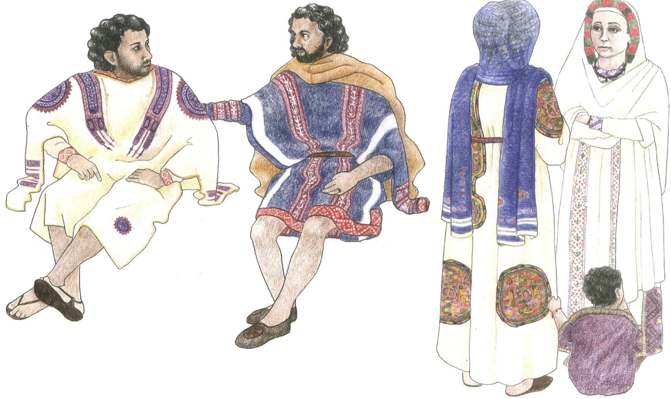
Afb. 4 Reconstructietekening van kleding zoals gedragen in de zevende tot en met de negende eeuw n. Chr. (tekening: auteur).