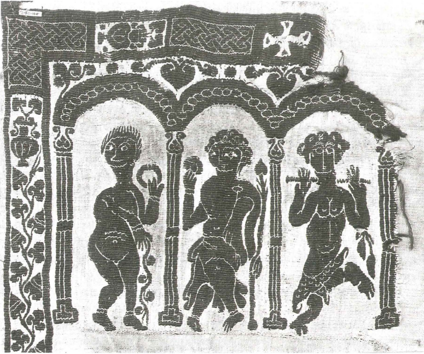
Afb. 5 Detail van de decoratie van een tuniek met daarop een dansend gevolg van Dionysos en een kruis (© Victoria and Albert Museum, London).

nieren zoals borduursel en brokaat werden gedurende deze en latere eeuwen ook gebruikt. Stukken met een ingeweven, herhalend patroon (bv. met gebruikmaking van technieken als taqueté en samiet) in wol en zijde kwamen ook voor, maar hier zijn over het algemeen slechts kleine fragmenten van gevonden.