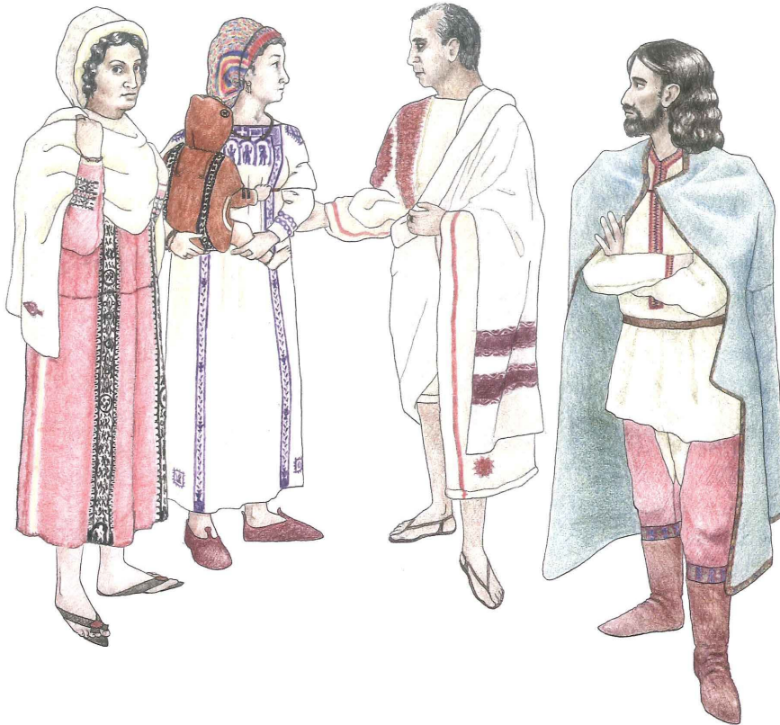
Afb. 2 Reconstructietekening van kleding zoals gedragen in de vijfde en zesde eeuw n.Chr. (tekening: auteur).

populairder. Had paars zijn aantrekkingskracht verloren? Of was het feit dat iemand zich een heel scala aan kleuren kon veroorloven een teken van welvaart? Opvallend is ook een toename vanaf de zevende eeuw in het gebruik van het scharlakenrood van de lakluis, dat uit Azië werd geïmporteerd. Mogelijk was deze voorkeur voor veelkleurigheid ook een invloed uit het Oosten.