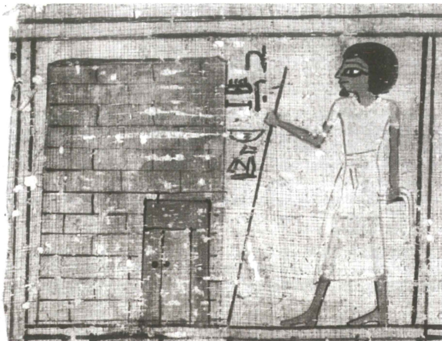
Nebamon op weg naar huis. Naar: R.O. Faulkner, The Ancient Egyptian Book of the Dead (ed. C. Andrews; London 1985), 124.

“Beiträge zum Alten Ägypten”. Daarin presenteert hij een rekonstruktie van het document uit Dyn. 18 (Toetmosis III – Amenhotep II). Hij bespreekt de volgorde, naam en titels van de bezitter met diens familie, spelling en schrift. Daarna vergelijkt hij uitvoerig de vignetten met illustraties in andere dodenboeken (Dyn. 18–20) en elders, hier ook polychroom afgebeeld. Ten slotte volgen 56 kleurenfoto’s, die het bewaarde volledig toegankelijk maken. Daardoor kunnen het door de Buck bepleite verfijnde tekstonderzoek en nieuwe vignettenstudies verwezenlijkt worden.