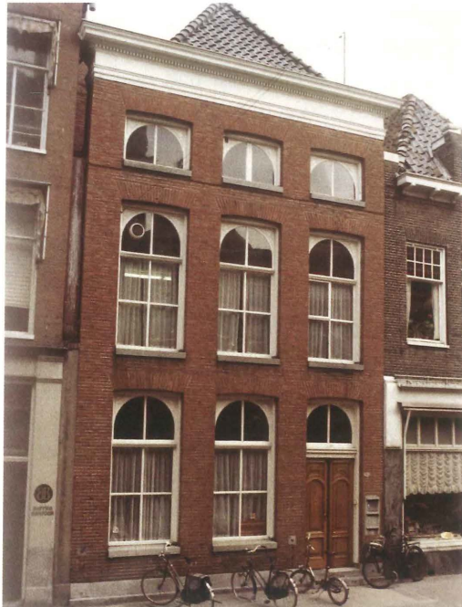
Afb. 4. Het Instituut aan de Oude Boteringstraat 43 (1977).

Korendijk, die het ook voor elkaar kreeg dat er in Engeland van het gezicht van de mummie een drie-dimensionale reconstructie werd gemaakt.