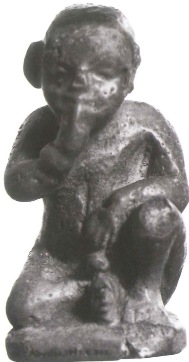
Harpokrates. Oxford 1896–1908 E 2199.

iemand “Harpokrates maken ( reddo )” zelfs voorkomt als synoniem van “stil laten zijn”. 2